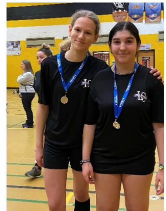
Ball hockey Regionals