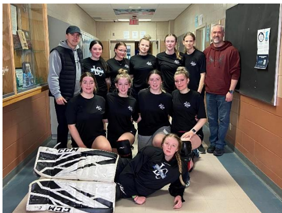
Ball hockey Provincials