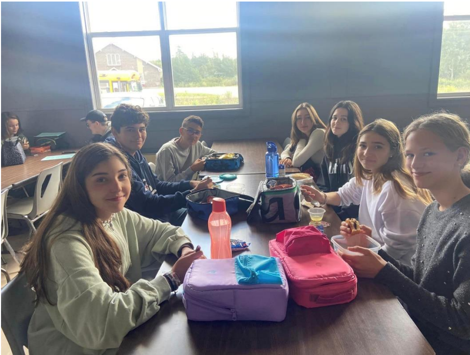
Mein erster Schultag in Kanada mit den anderen Austauschschülern aus Spanien

verschiedene Städte auf der Insel besichtig und war unter anderem an einem der östlichsten Punkte Nordamerikas. Generell habe ich viele Gewohnheiten und Traditionen Kanadas und Neufundlands im speziellen kennengelernt, wie den Ugly Stick, ein selbstgemachtes Musikinstrument, Schneemobil fahren, Quad fahren, das Verbringen von Wochenenden in kleinen Holzhütten im Wald und vieles mehr.