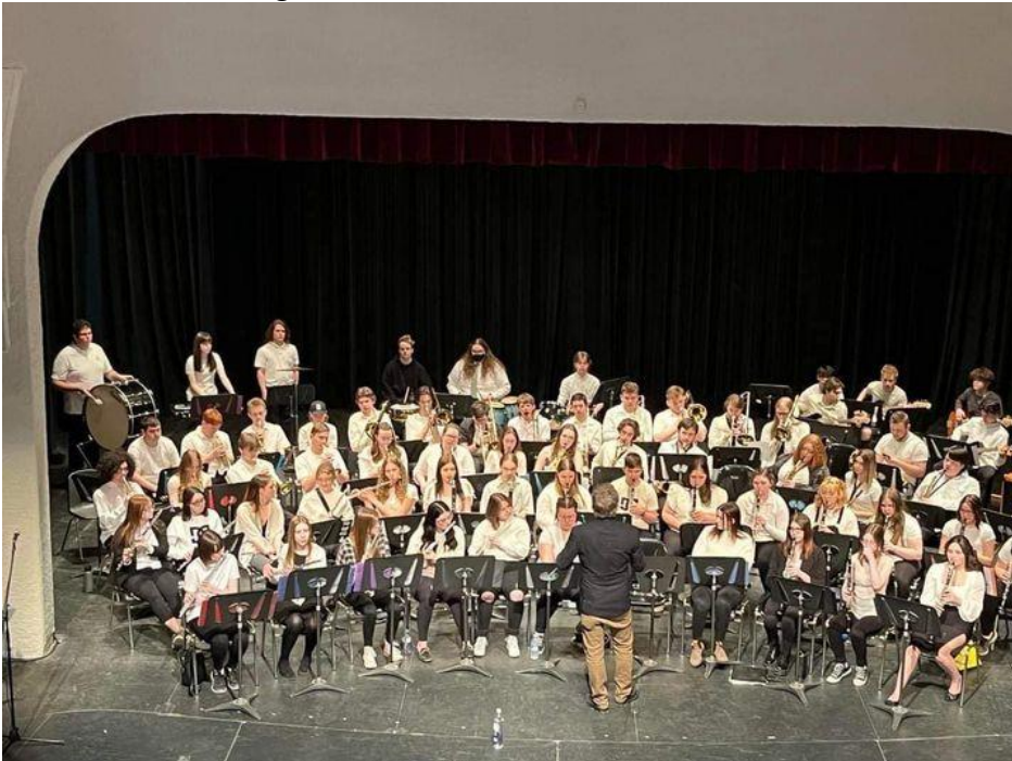
Der Auftritt mit der Konzert Band beim Schulvergleich