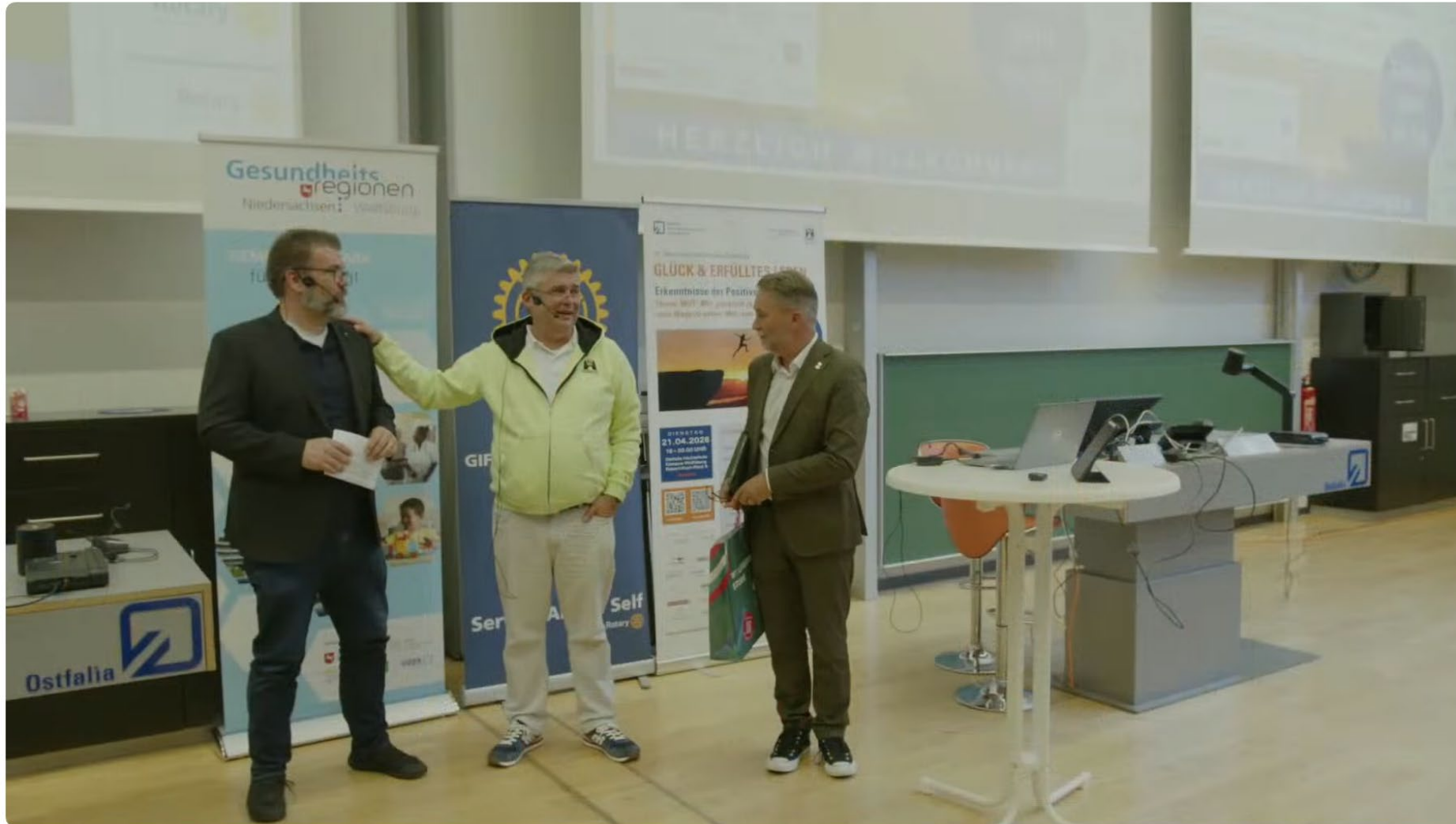
Glück & erfülltes Leben: Erkenntnisse der Positiven Psychologie